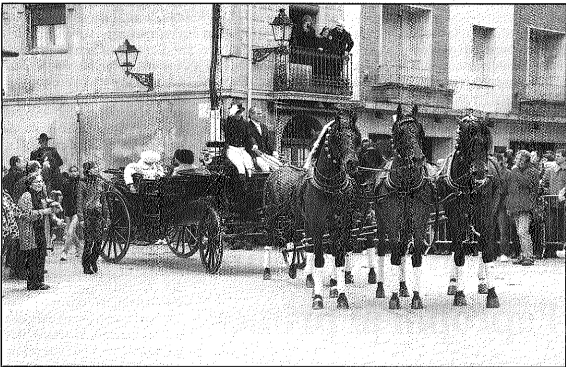
Un gran carruatge estirat per cinc cavalls va tancar la comitiva

REDACCIÓ. Sant Celoni A primera hora del matí de diumenge s'esperava amb neguit, al costat del centre d'esports del Sot de les Granotes, l'arribada de cavalls i carruatges per la celebració dels Tres Tombs de Sant Antoni Abad a Sant Celoni. La lleugera pluja i el mal temps feien témer perquè la participació de cavallistes a l'acte fos prou vistosa.