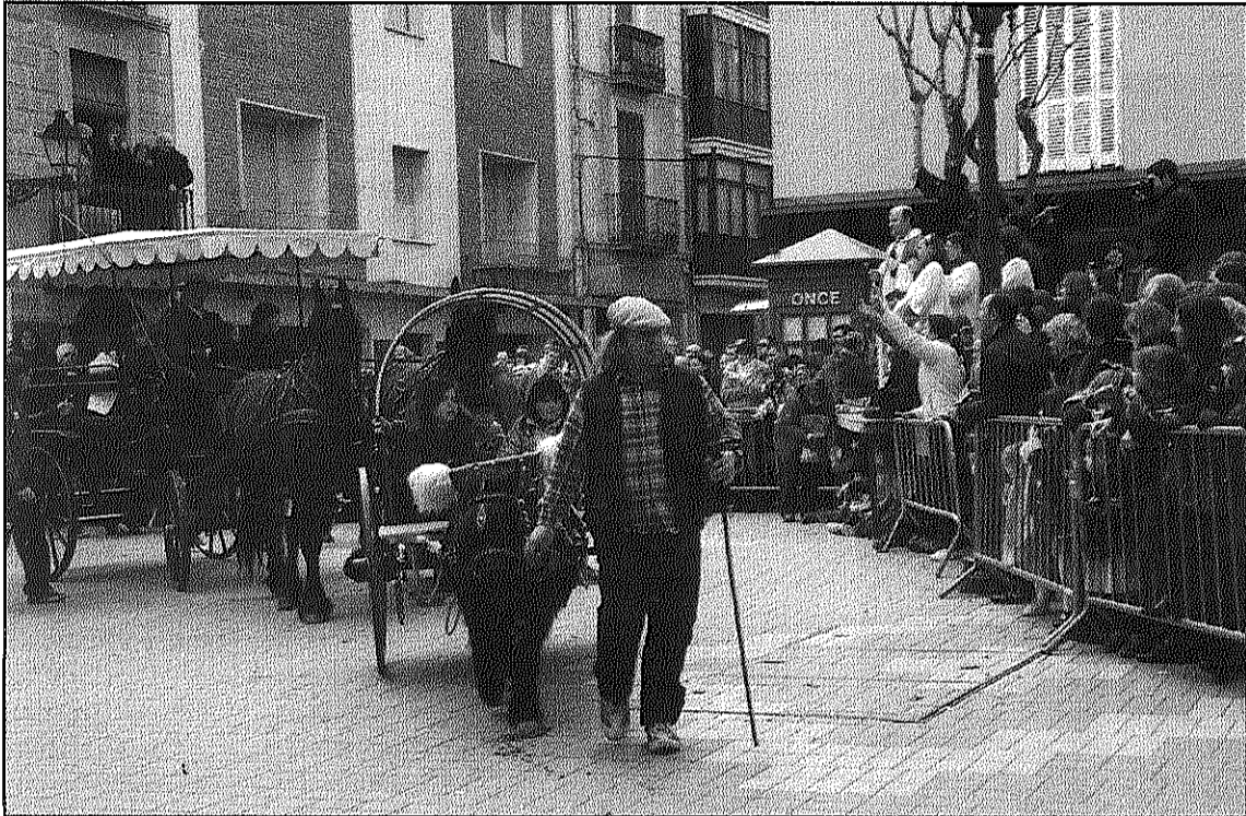
Alguns dels participants es van decorar enganxalls i carrosses amb elements tradicionals

Uns 15 carruatges i prop de cinquanta cavalls van desfilat pel centre de la vila