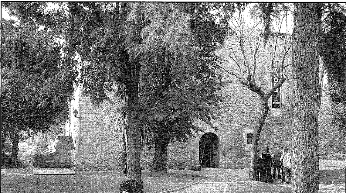
La Rectoria Vella acollirà a partir de dissabte aquesta mostra del treball de Tharrats (L'AdBM)

La mostra recull 26 obres cedides per la família Tharrats, corresponents a maculatures realitzades entre el 1954 i el 1975. Aquesta tècnica mixta creada per Tharrats el 1954 sorgeix de les màcules d'impremta: del full imprès de manera defectuosa, que s'encalla entre els corròns de la premsa i es taca per les retintades successives. Tharrats descobreix que les màcules poden aconseguir, per atzar, una gran bellesa. L'artista treballa sobre aquesta base i l'enriqueix: explora nous procediments plàstics i nous materials a partir de l'atzar i la troballa.