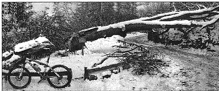
Los ciclistas del Jabalí Bikers de Sant Cebrià de Vallalta fueron los primeros en encontrarse con el roble derribado por el temporal.

A unque al parecer tenía los días contados, el bicentenario roble de Santa María de Montnegre no podía soportar el temporal de nieve y viento que sorprendía al parque natural del Montnegre-Corredor el jueves de la pasada semana. El roble había sido catalogado por la Generalitat como uno de los árboles monumentales de interés nacional, siendo considerado como uno de los mayores de Catalunya, con una altura de 25 metros, un perímetro de 4'65 m. y una copa que llegaba a los 24 metros de diámetro y se encontraba junto a la recién restaurada ermita de Santa María, actualmente dentro del término municipal de Sant