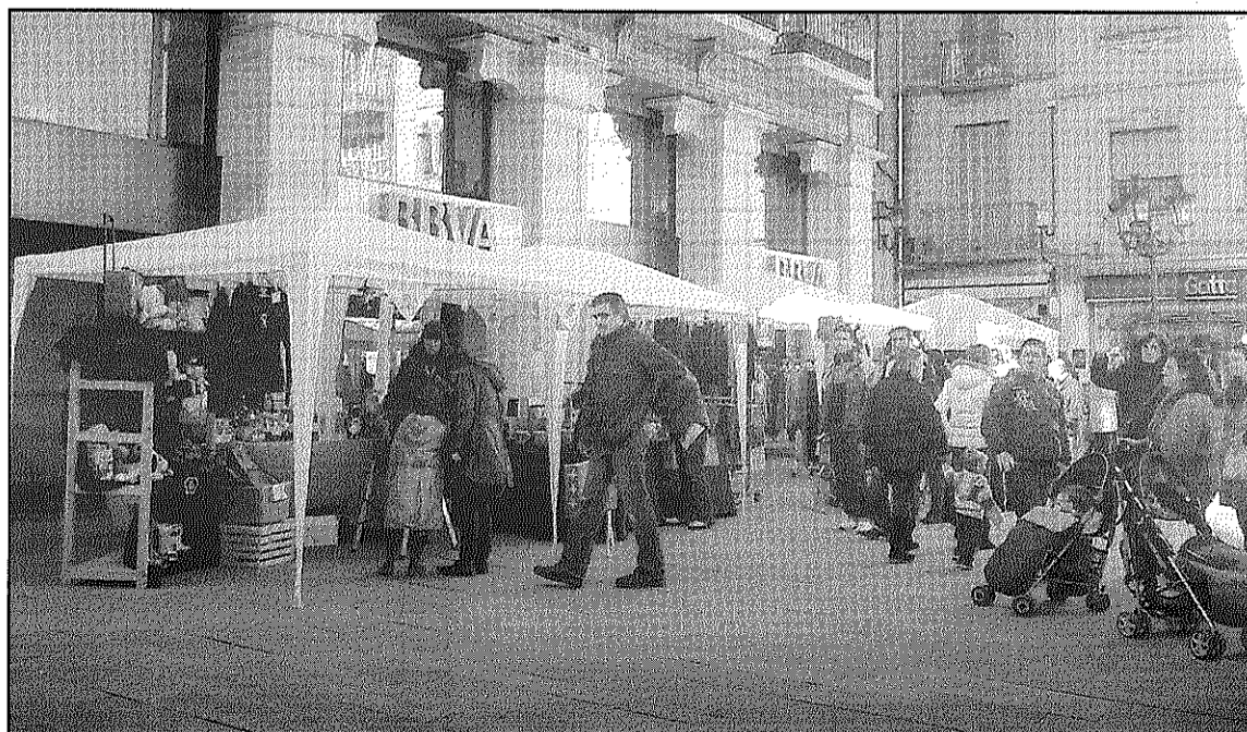
Una imatge de les parades que es van instal·lar per les Rebaixes al carrer a Sant Celoni

D'altra banda, ahir dijous, Sant Celoni Comerç es va reunir amb empresaris i empresàries del sector de la perruqueria, de la estètica i de la perfumeria per engegar una campanya de promoció d'aquests sectors i potenciar els seus serveis.