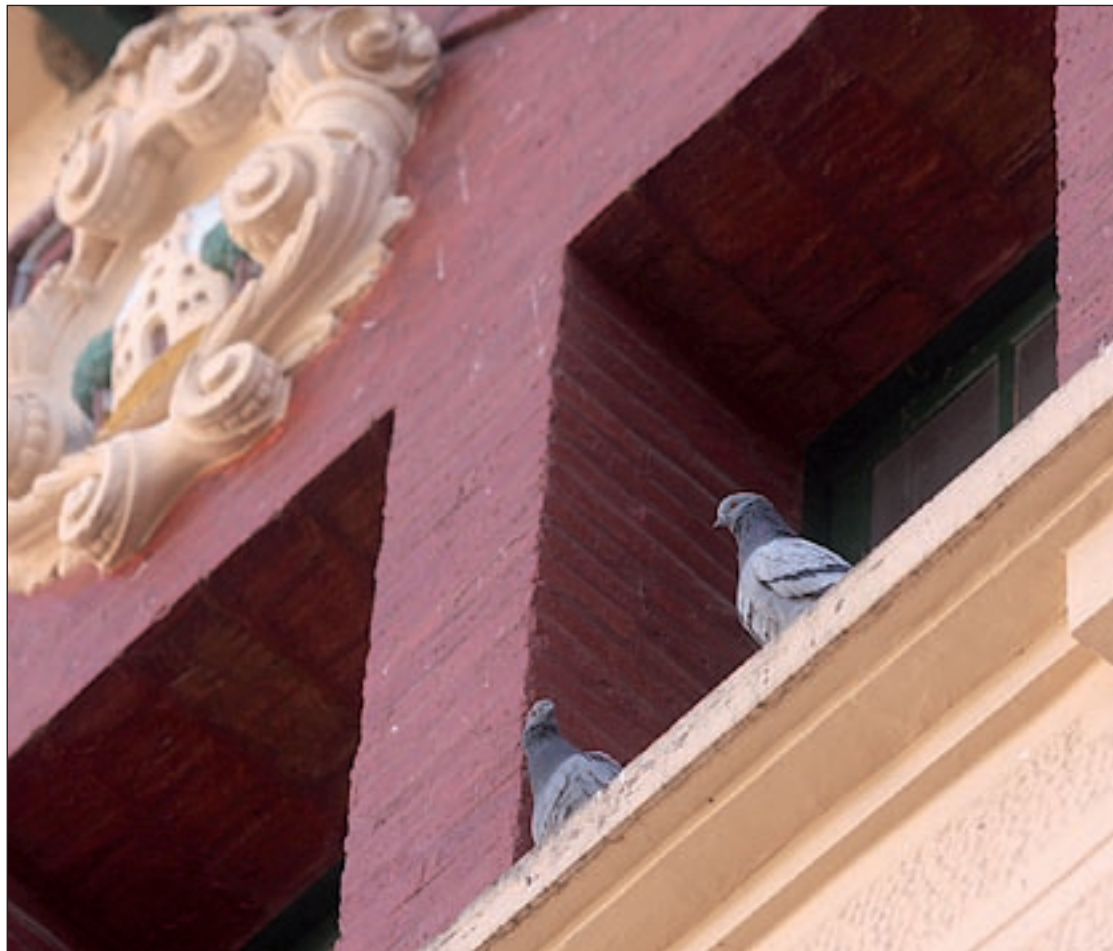
Uns coloms a l'edifici de l'Ajuntament de Santa Maria de Palautordera

Els últims anys, les colònies de coloms han augmentat a la vall de la Tordera. Tot i que en principi aquesta espècie és d'hàbits establerts i no és fàcil moure'ls de l'emplaçament on es troben, sembla que aquest increment de l'espècie es deu a la migració dels ocells de Barcelona, que