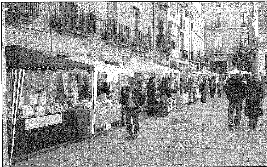
Una imatge de l'edició passada de les 'Rebaixes al carrer' de Sant Celoni Comerç

Una de les novetats de les 'Rebaixes al carrer' d'enguany serà la incorporació de concessionaris d'automoció a la convocatòria. Quatre concessionaris locals exposaran vehicles d'ocasió a la plaça de la Vila en un any en què no s'han celebrat les fires dels vehicles, nous i d'ocasió, que s'havien fet en anys anteriors. En aquest sentit, assenyala Sant Celoni Comerç, els concessionaris han vist amb bons