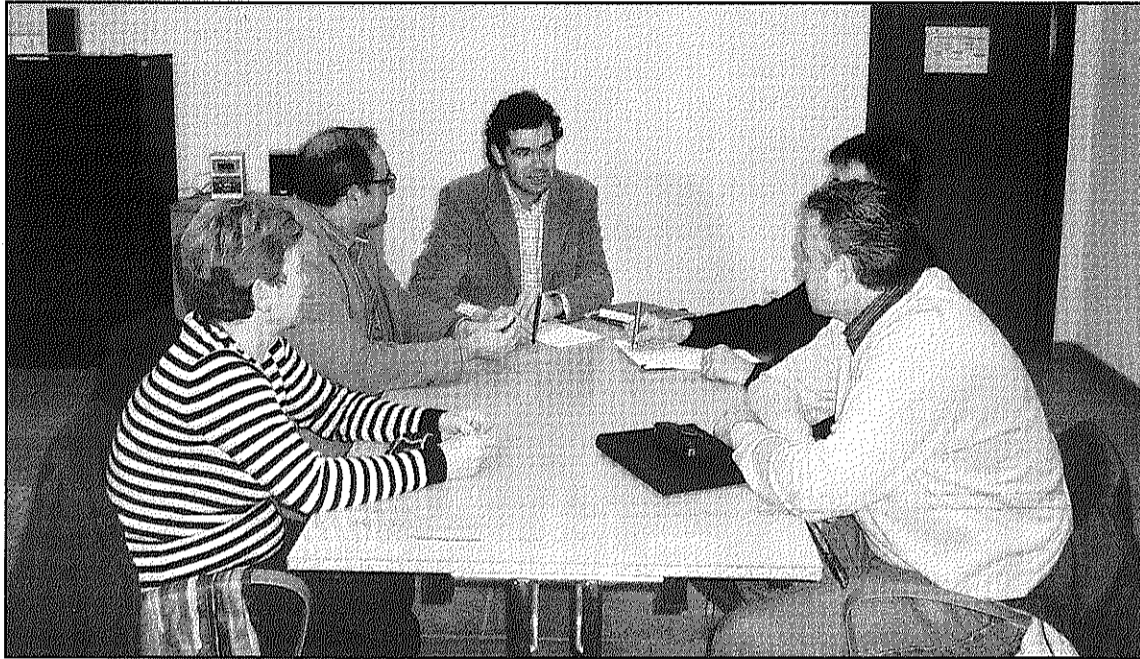
La reunió mantinguda entre el Consell de Poble i l'Ajuntament de Sant Celoni (L'AdBM)

A la reunió es va assenyalar que durant el mes d'abril un agent cívic, contractat a través d'un Pla d'Ocupació de la Diputació, recorrerà la Ballò-