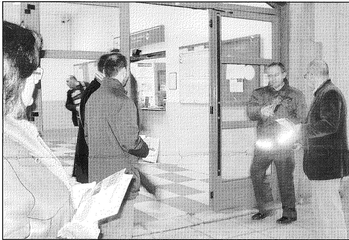
CiU va repartir dimecres, a l'estació de Sant Celoni, fulletons informatius del traspàs

Segons CiU, les principals deficiències del traspàs ferroviari se centren en elements com el fet que només es traspassa Rodalies, "ja que la Generalitat ni tan sols ha demanat Regionals, tal com va aclarir el Ministre Blanco", una mesura que es preveia l'article 169 de l'Estatut de Catalunya. A més la formació considera que