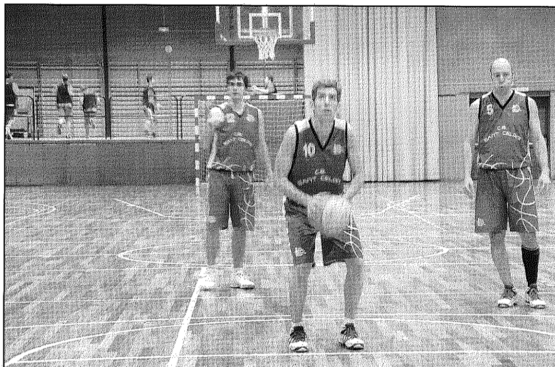
Una imatge del partit entre el CB Sant Celoni i el CB Canet de dissabte passat

Al grup quart de Tercera catalana, el CB Sant Celoni visita dissabte, a les 4 de la tarda, la pista del CB Tiana , rival a la zona mitjana alta del grup. Tot i amb això, els celonins venen de perdre 81-92 davant el CB Canet en un partit marcat per una defensa no massa encertada dels locals, un gran encert de tir dels visitants, en especial en el darrer quart, i un arbitratge polèmic que amb un