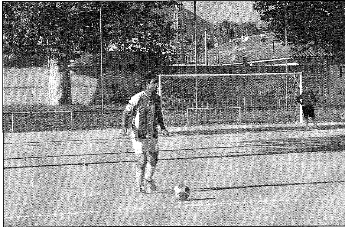
El CF Inacsa ha tornat a situar-se en el grup dels equips del capdamunt de la classificació (L'AdBM)

En el cas de la UD Pitres, en la darrera jorandada va haver de bregar de valent per imposar-se 2-3 al camp del CE Llinars B. Un partit on, malgrat la UE Pitres va controlar de principi, els de Llinars van encertar a obrir el marcador en una jugada treballada per la banda esquerra. La resposta visitant no va trigar a arribar i a partir d'aquest moment els