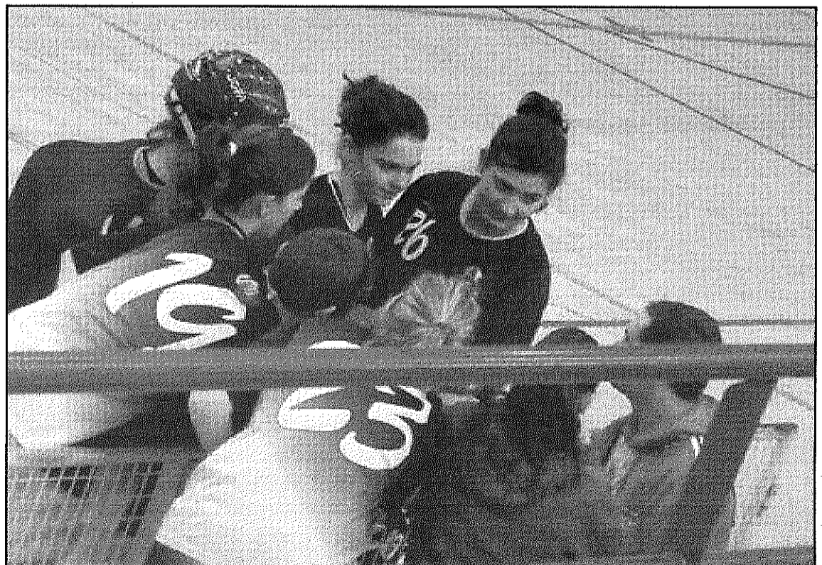
L'equip del CP Breda femení

Pel que fa a la Primera catalana femenina, el CB Breda tindrà aquest cap de setmana jornada de descans. El conjunt bredenc segueix sense haver pogut sumar cap victòria en les 14 jornades disputades. El darrer cap de setmana, l'equip va saltar amb una derrota per 0-6 la visita que va tenir del CE Arenys d'Amunt.