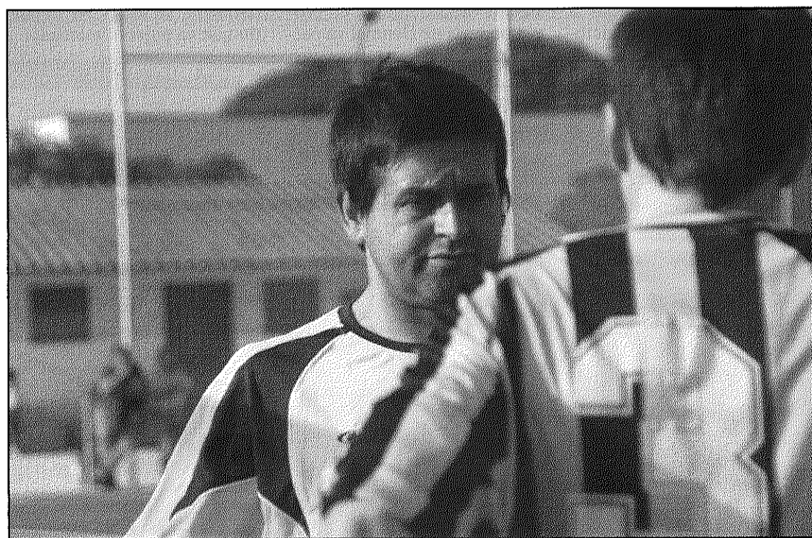
Els jugadors de l'AC Hostalric s'han retrobat amb les golejades d'inici de campanya

Per la seva banda, l'EF Arbucienca rebrà dissabte, a les 4 de la tarda, la UE Maçanet de la Selva. L'equip d'Arbúcies ve d'empatar 2-2 al camp del FA Maçanet en un partit on el més destacat no va ser el marcador sinó un arbitratge pessim i una baralla organitzada pel conjunt local que va ser el colofó d'una segona part marcada per la duresa. El matx,