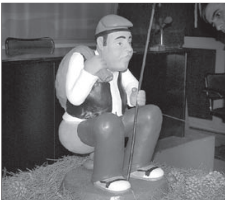
El caganer de Sant Feliu és un pagès amb un sac i un ganxo

A més d'una sèrie de caganers que s'han posat a la venda perquè tothom qui ho vulgui el pugui tenir al pessebre, se n'ha fet un d'aproximadament mig metre d'alçada. Aquesta figura quedarà en propietat de l'Ajuntament en els propers anys i, per les dates de Nadal, es podrà col·locar cada any en un equipament diferent.