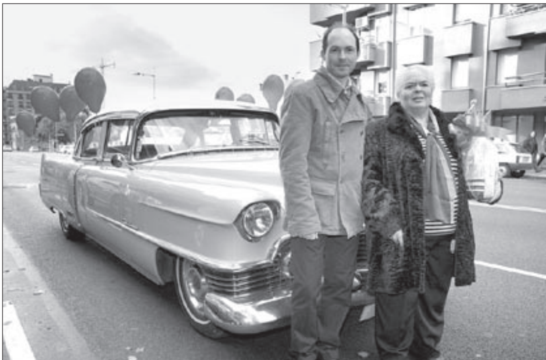
L'afortunada del sorteig i el seu fill, aquest dimecres al matí abans de començar el recorregut en cotxe d'època

Aquesta només és una de les activitats nadalenques que ha organitzat l'entitat. També s'ha fet una recollida de joguines per a les persones necessitades.