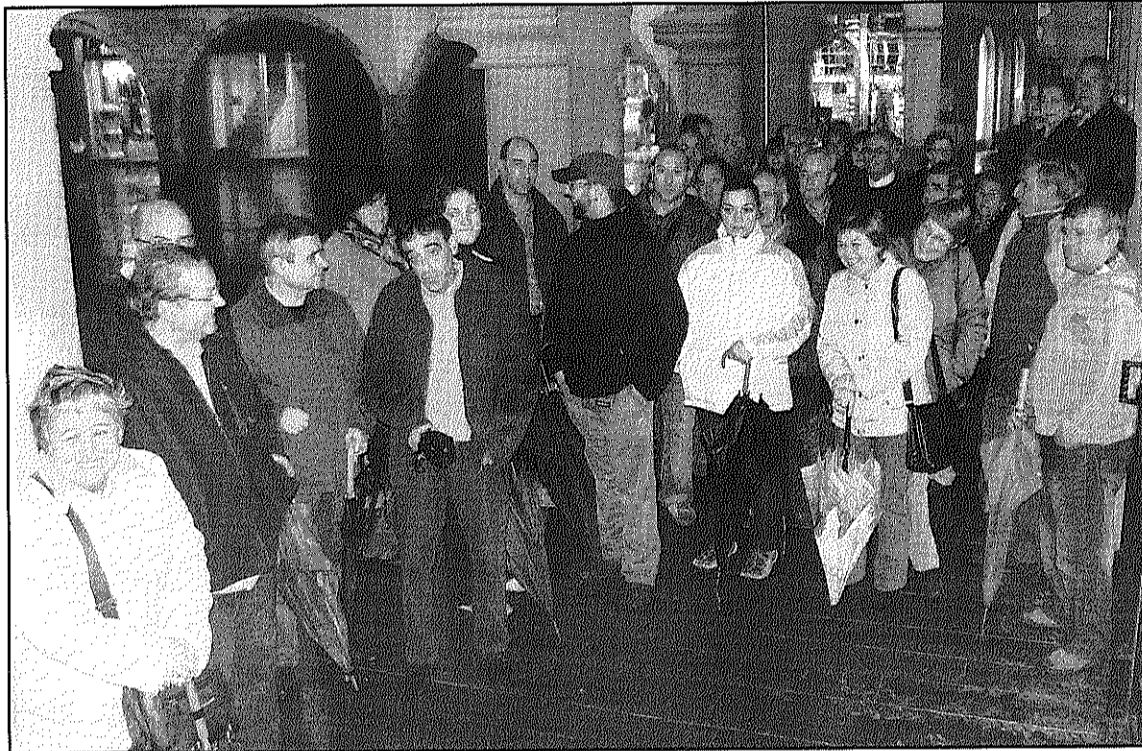
Els veïns van fer una concentració, fa prop d'un any, davant l'Ajuntament com a protesta