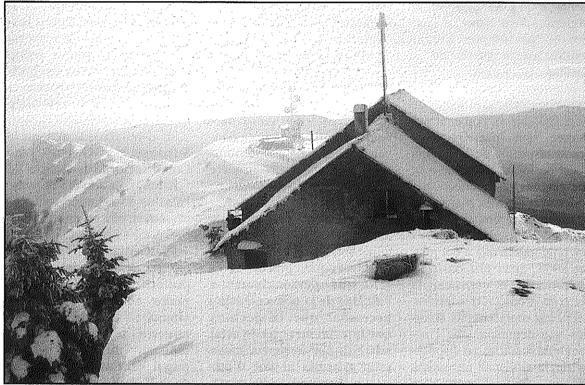
La Generalitat ha recuperat aquest 2010 l'Observatori del Turó de l'Home (EM)

L'Observatori, el primer de la península, va ser un projecte de l'Associació Catalanista d'Excursions Científiques de l'any 1881. Llavors, però, la iniciativa es va abandonar per les destrosses que hi va produir una forta tempesta. Aquesta es va reprendre anys més tard i l'estiu del 1932 es va inaugurar sota l'impuls d'Eduard Fontserè, la Secció de Ciències de l'Institut d'Estudis Catalans, la Generalitat i altres col·laboracions com la