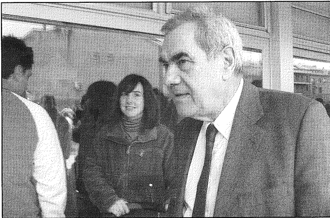
El Conseller d'Educació Ernest Maragall a la inauguració de la llar d'infants a Sant Celoni

Deulofeu assenyala que a la reunió es van emplaçar a una nova trobada d'aquí a un parell de setmanes per confeccionar els estudis que determi-