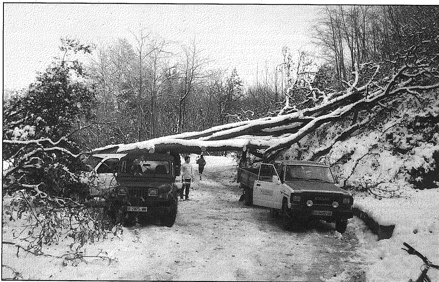
Efectius del cos de bombers i de l'ADF van retirar, el cap de setmana, les branques de la pista forestal

La tempesta de vent i neu tomben el roure bicentenari de Sant Celoni que feia 24,5 metres d'alçada (Pàgina 4)