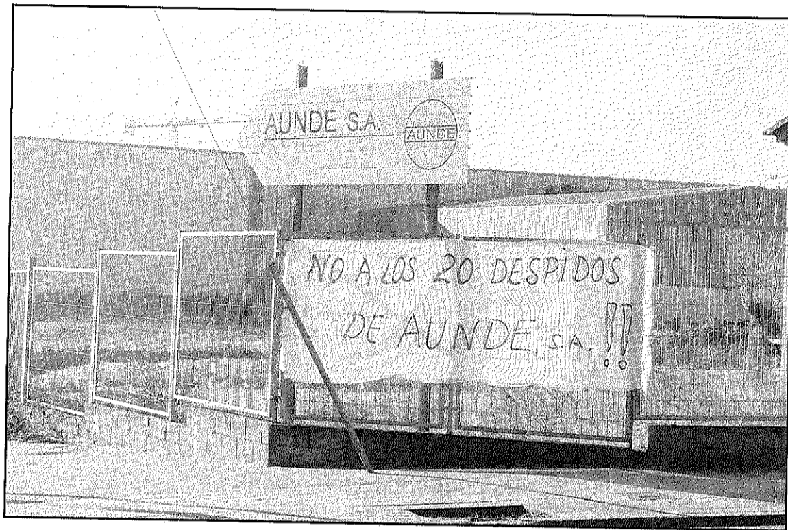
Els treballadors tenien previst iniciar una vaga aquesta setmana pels 22 acomiadaments (L'ADBM)

En conèixer la notícia es va celebrar una assemblea del conjunt dels treballadors de la planta celonina de l'empresa que va comptar amb 48 persones assistents. D'aquestes,