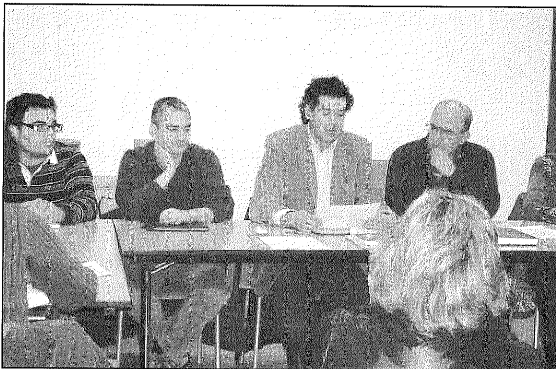
Una imatge de la sessió plenària del Consell de Poble de la Batllòria, aquest dimecres