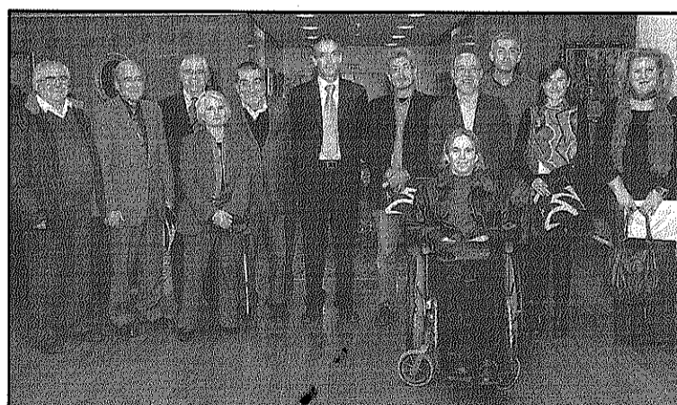
L'acte de lliurament de l'ajut, celebrat a Mataró (L'AdBM)

REDACCIÓ. Sant Celoni La Fundació Acció Baix Montseny ha rebut de la Caixa Laietana una aportació de 41.000 euros per reforçar la tasca que promou l'entitat en la integració i la millora de les condicions de vida de persones amb discapacitats físiques i psíquiques. L'acte de lliurament de l'aportació es va fer el passat dimarts, 17 de novembre, a Mataró. L'alcalde de