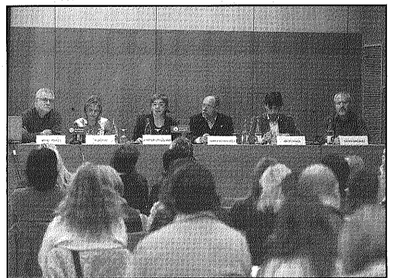
Una imatge de la jornada celebrada dilluns

Durant la seva intervenció, Deulofeu va posar de relleu, també, la necessitat d'impulsar un nou model de finançament local ja que els ajuntaments han assumit serveis sense tenir-ne competències.