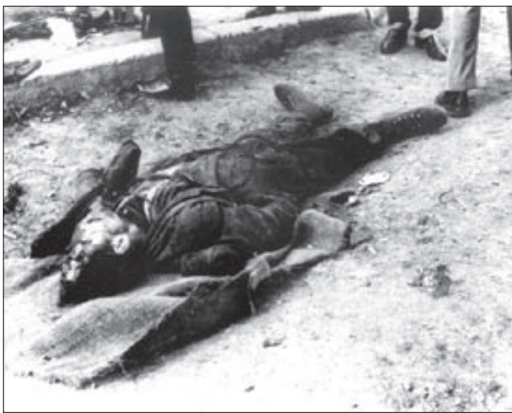
El cadàver de Quico Sabaté estès a terra amb el rostre desfigurat pels trets