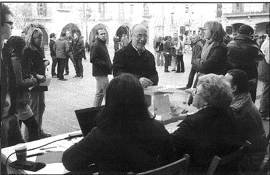
Sant Celoni. L'alcalde del municipi votant a la plaça de la Vila (L'AdBM)