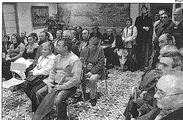
Los vecinos piden explicaciones al gobierno sobre la discoteca.

En el vecindario tienen la sensación de que la voluntad para resolver el problema, por parte del Ayuntamiento, no existe, puesto que sólo se cree en la buena voluntad de la discoteca y la de su asesor, dicen. Por otra parte son del parecer que el ayuntamiento no tiene en cuenta la problemática de todo un barrio, puesto que les informaron de