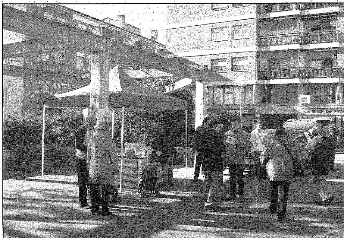
Cardedeu Decideix ha organitzat taules informatives. A la foto, la del barri dels Estalvis