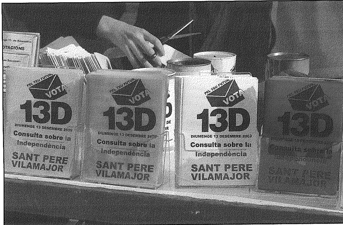
Els municipis intensifiquen els actes informatius per preparar la consulta popular

Cardedeu. S'ha organitzat un cicle de cinema que s'obre avui, a les 9 del vespre, amb la