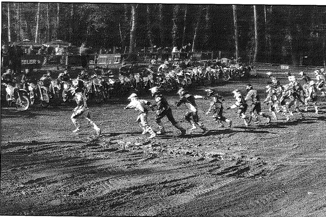
Una imatge d'una de les darreres proves celebrades al Parc Motor de Vallgorguina

L'activitat del MotoClub Sant Celoni substitueix la que es va suspendre