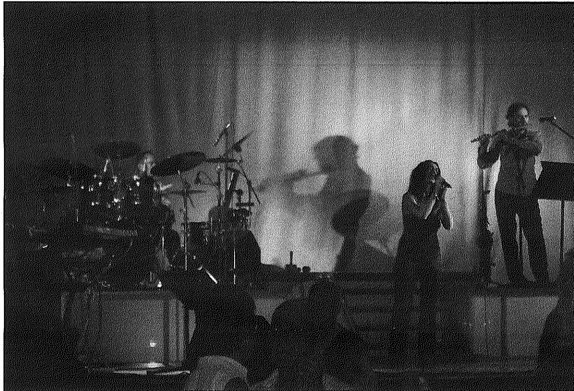
L'orquestra Setson protagonitza el ball de l'Ateneu de Sant Celoni aquest cap de setmana

REDACCIÓ. Sant Celoni Aquest diumenge, a les 6 de la tarda, la sala gran de l'Ateneu de Sant Celoni serà l'escenari del concert i ball d'octubre que estarà amentitzat per l'orquestra Setson. Per una entrada de 7 euros els assistents