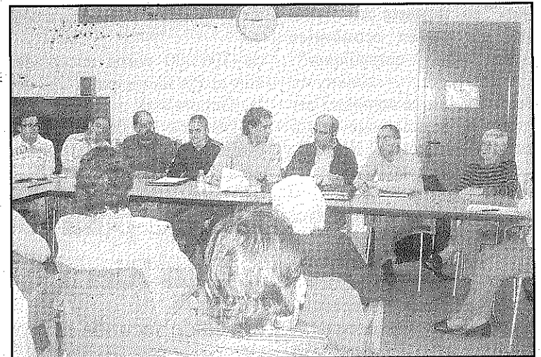
Una imatge del Ple del Consell de Poble de la Batllòria (L'AdBM)

D'altra banda, durant el Ple també es va informar de l'estat de l'enquesta sobre seguretat i civisme feta a la població. La