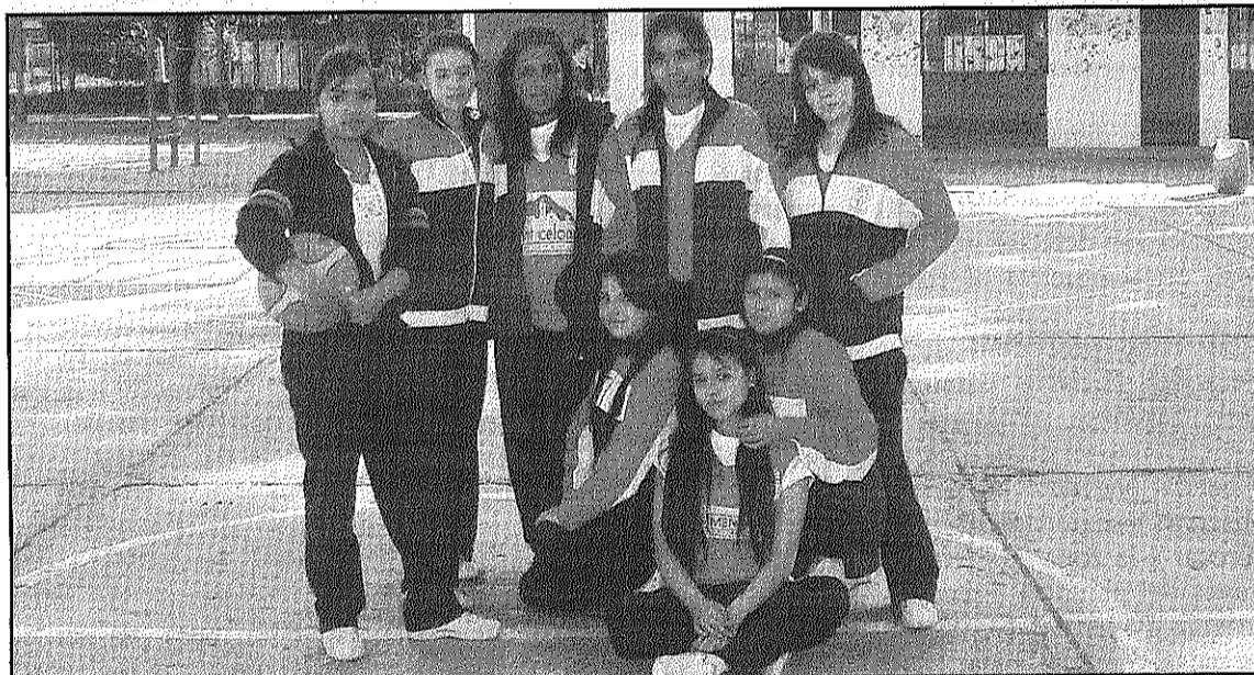
Els alumnes de les dues institucions ja llueixen els xandalls del club celoní (CB SANT CELONI)

REDACCIÓ. Sant Celoni El Club Bàsquet Sant Celoni ha fet donació de prop de 3.000 quilos d'equipament i xandalls vells a dues institucions de Colòmbia. Es tracta de la Institució educativa