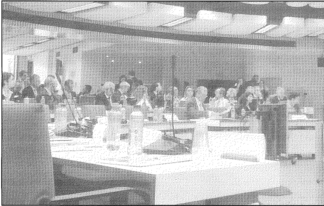
Una imatge de la presentació a Brussel·les del projecte de transport ferroviari europeu (L'ADBM)

REDACCIÓ. Sant Celoni Fermed, el lobby empresarial integrat per més de 150 empreses i institucions va reclamar aquest dimarts, 27 d'octubre, amb un acte a Brussel·les, que es prioritzi el corredor Mediterrani ferroviari per connectar el nord d'Europa amb el sud de l'Estat espanyol, travessant Catalunya. Entre les propostes presentades per Fermed hi figura la posada en funcionament, abans del 2015, d'una nova línia de transport de mercaderies d'ample internacional entre Sant Celoni i el sud de Tarragona, que passaria pel Papiol, Vilafranca del Penedès i Reus i que comptaria amb connexions a les terminals de ports i principals zones industrials. També es va proposar que es construïssin una nova línia, entre el 2016 i el 2020, entre el nord de Girona i Sant Celoni, d'ample internacional, que permeti completar un gran 'by pass' fins a Barcelona. A més, també demana canviar a amplada internacional la via de Girona a Sant Celoni i de Tarragona a Castelló.