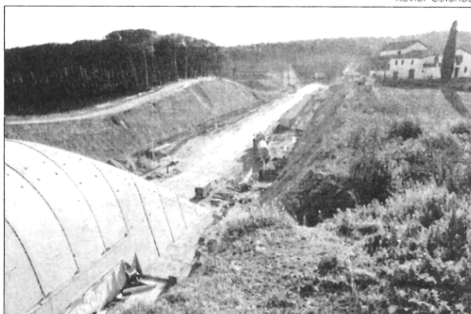
Dentro de unos meses, casa con vistas al... AVE.

Santa Maria de Palautordera, el tren se adentrará en un entorno distinto, rompiendo un paisaje hasta hace poco poblado de bosques, prados y pequeños núcleos de construcciones, hoy en expansión. Además, se trata de una zona próxima a los parques naturales del Montseny y el Montnegre-Corredor, donde existen varios corredores biológicos.