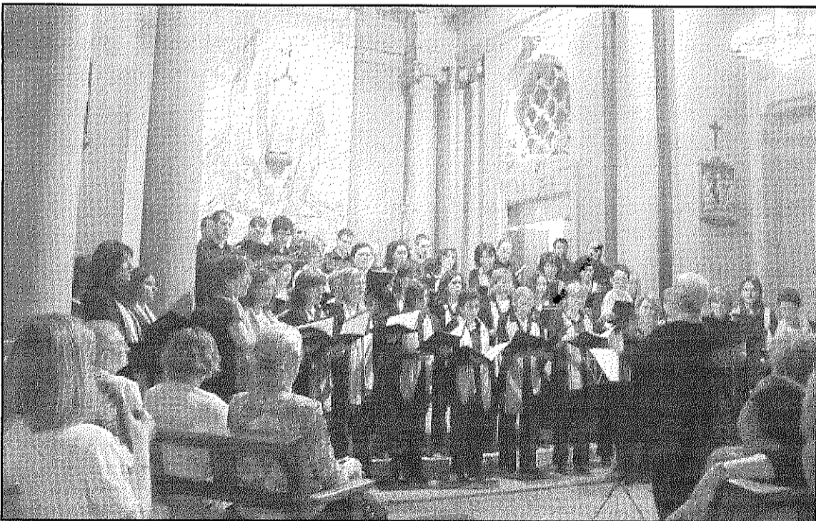
El Cor Llevant oferirà un repertori variat de diverses èpoques i autors

A partir d'aquest any es va convertir en cor de veus mixtes i des del 1985 és membre de la Federació Catalana