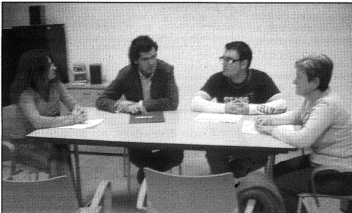
Una imatge de la reunió de la Comissió de Cultura del Consell de Poble de la Batllòria

També es va apuntar la possibilitat de fer un concurs d'engalanar balcons amb motius nadalencs per ambientar la celebració i es va valorar amb entusiasme la proposta de la Colla gegantera d'incorporar els gegants als actes festius de la Batllòria per celebrar el seu 20è aniversari. Finalment, es va demanar que actes com la cavalcada de Reis tinguin un major relleu i siguin més emotius, així com comptar amb la visita d'un patge reial al que