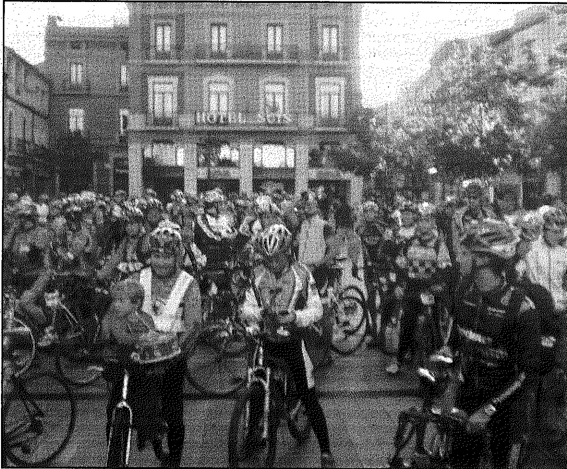
Els ciclistes participants a la Massaiada en honor a Novell van omplir la plaça de la Vila

El president del Club Ciclista Sant Celoni va fer un parlament a la plaça de la Vila