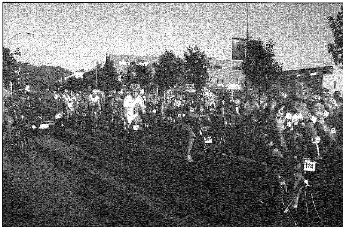
Una imatge dels participants de la desena edició de la Pujada al Turó de l'Home del CCSC

Un total de 195 participants van aconseguir coronar el cim del Turó