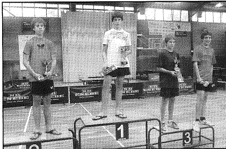
Els vencedors en Federat Infantil (L'AdBM)