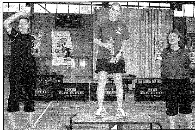
Pòdium de Federat Femení (L'AdBM)

REDACCIÓ. Sant Celoni. El Club Amics Tennis Taula Sant Celoni va organitzar diumenge passat, amb un gran èxit de participants, el Xè Torneig Tennis Taula de la Festa Major 2009. Un total de 80 jugadors de tot Catalunya, 50 federats i 30 aficionats, van participar en el campionat.