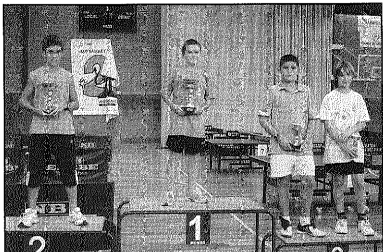
Els guanyadors en Aficionat Infantil (L'AdBM)

Els jugadors locals aconseguixen uns bons resultats en les diferents categories