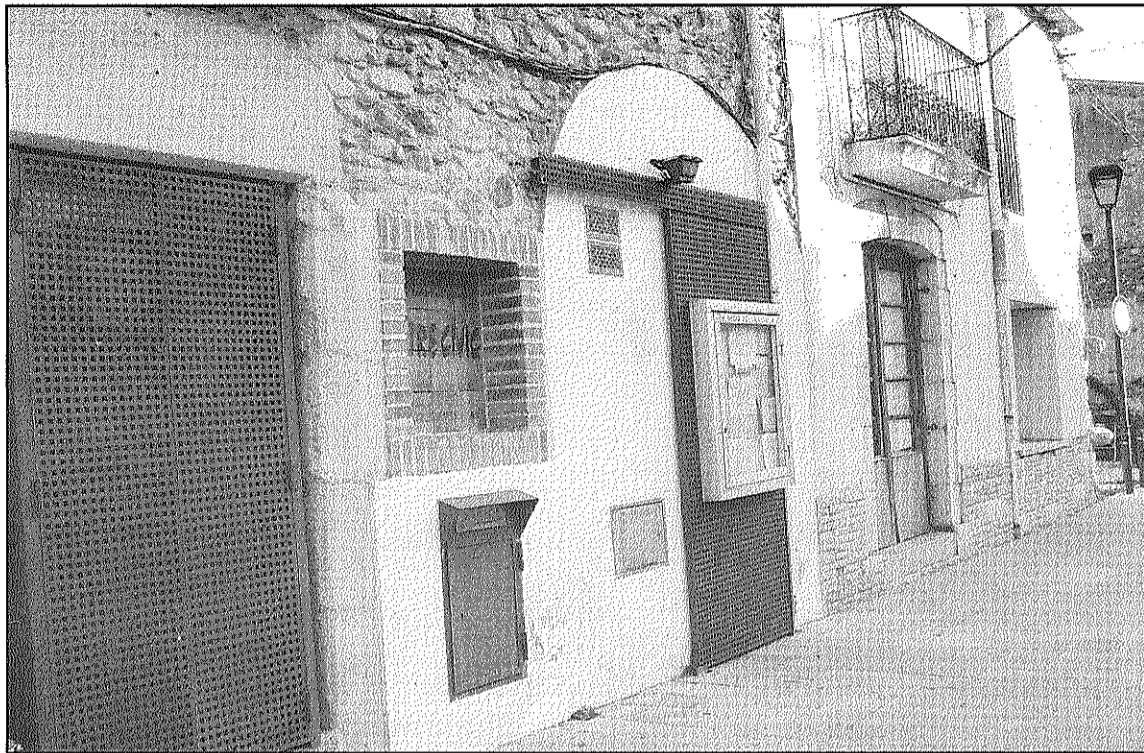
El Centre Cívic comptarà amb una placa que l'identificarà com a seu del Consell de Poble (L'ADBM)

Per aquest motiu, considera, "amb aquest fet d'establir la seu del Consell al Centre Cívic,