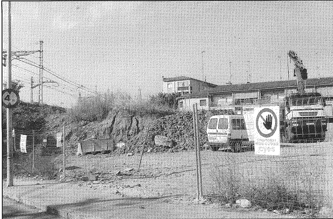
L'adjudicatària Cyes comença els preparatius per fer el calaix, esquelet del nou túnel (L'AdBM)

Aquesta operació, explica Deulofeu, està estipulada a finals