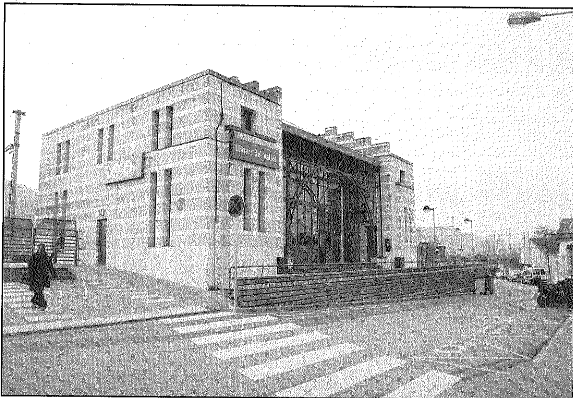
A l'estació de Llinars s'impermeabilitzarà la coberta de l'edifici de viatgers (L'AdBM)