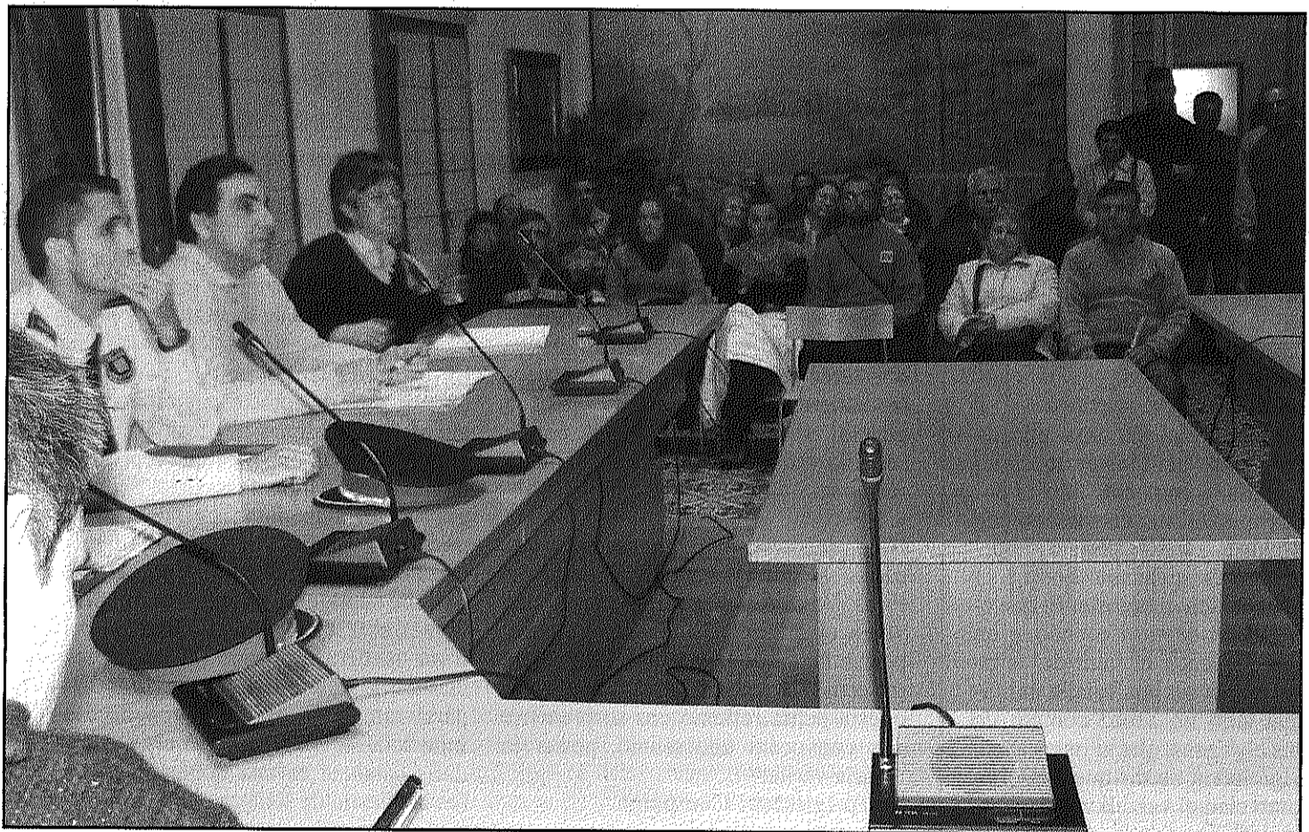
Una de les reunions mantingudes entre veïns, Ajuntament i policia per resoldre l'incivisme fora de la discoteca de Sant Celoni (L'AdBM)

Veïns del barri Baix Montseny i partits de Sant Celoni acorden avançar el tancament de la discoteca (Pàgina 3)