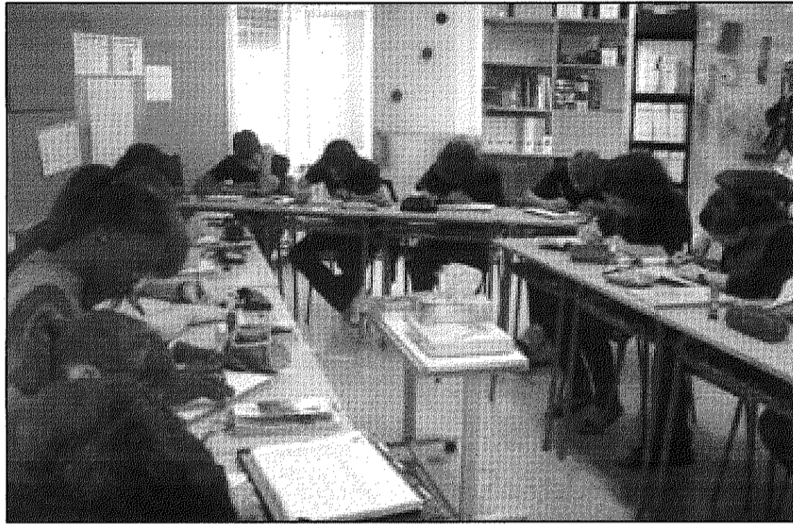
Els joves que participen al PTT podran obtenir a final de curs qualificació professional (L'AdBM)

L'objectiu del PTT és aportar als participants formació professional com a auxiliar en vendes, oficina i atenció al públic o auxiliar en muntatge d'instal·lacions elèctriques, d'aigua i gas, a més de formació pràctica en empreses i la formació bàsica per desenvol-