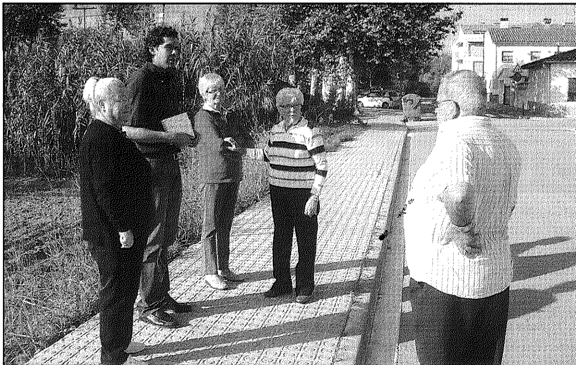
La Comissió es va reunir ahir, dijous, per decidir on es col·locaran els nous bancs

Durant la trobada, la Comissió de la Gent Gran va expressar altres preocupacions com la necessitat que es faci una neteja dels embornals del clavegueram o la poda