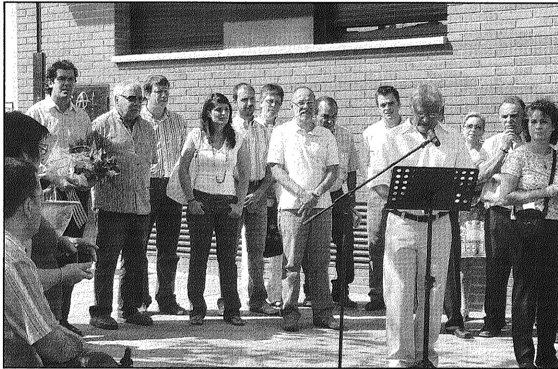
Al fons, representants dels grups polítics municipals a l'acte institucional de l'ofrena floral (L'ADBM)

En aquest sentit, l'alcalde ha assenyalat que "més que buscar el protagonisme dels grups polítics, els partits hem d'estar a disposició" si entitats celonines decideixen