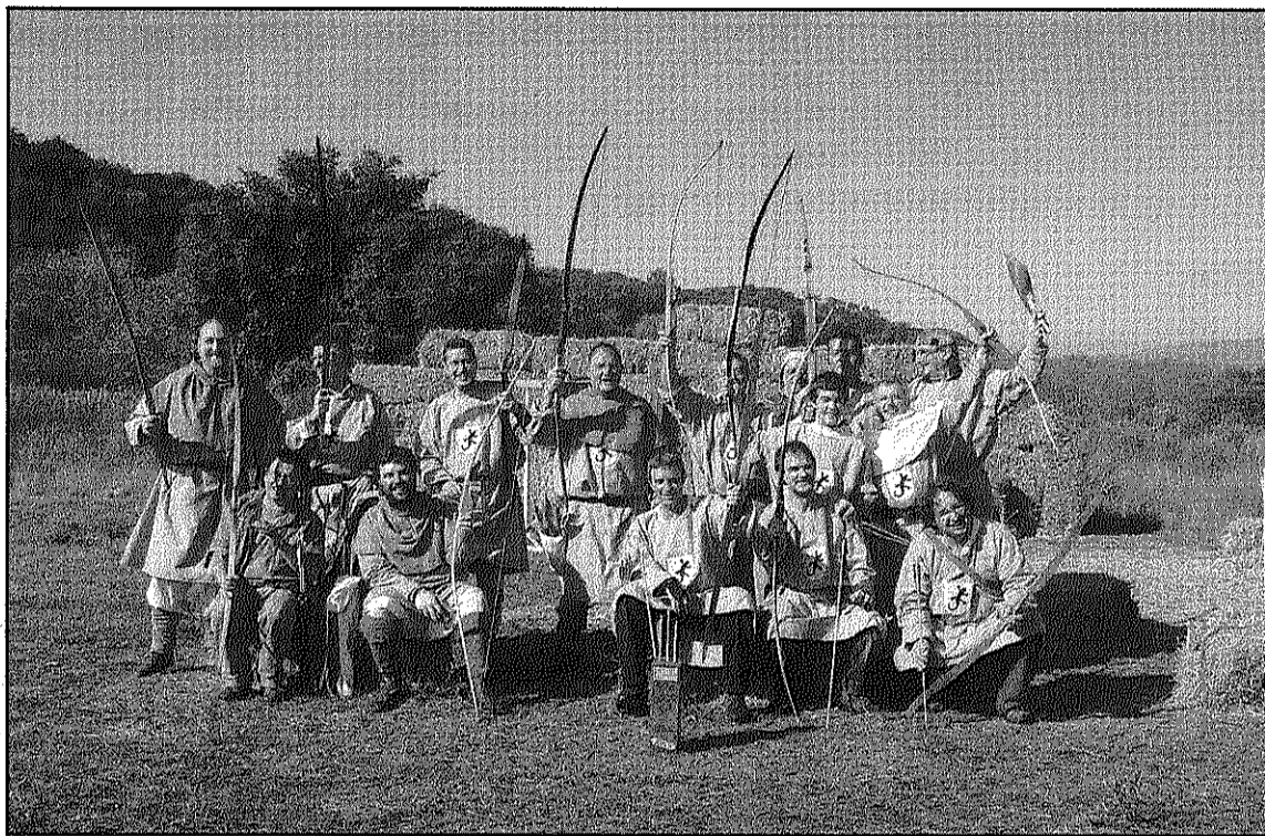
Els arquers participants en la recreació medieval organitzada per l'Arc Sant Celoni (L'AdBM)

Diumenge s va fer la recreació d'un concurs d'habilitat de