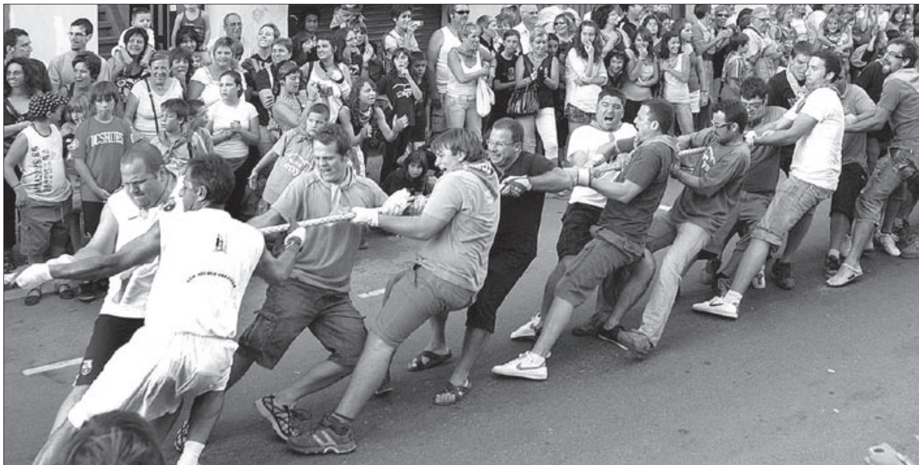
L'estirada de corda, aquest dilluns, va decantar la balança de la victòria cap a la colla dels Negres, encara que la categoria d'homes va ser per als Senys