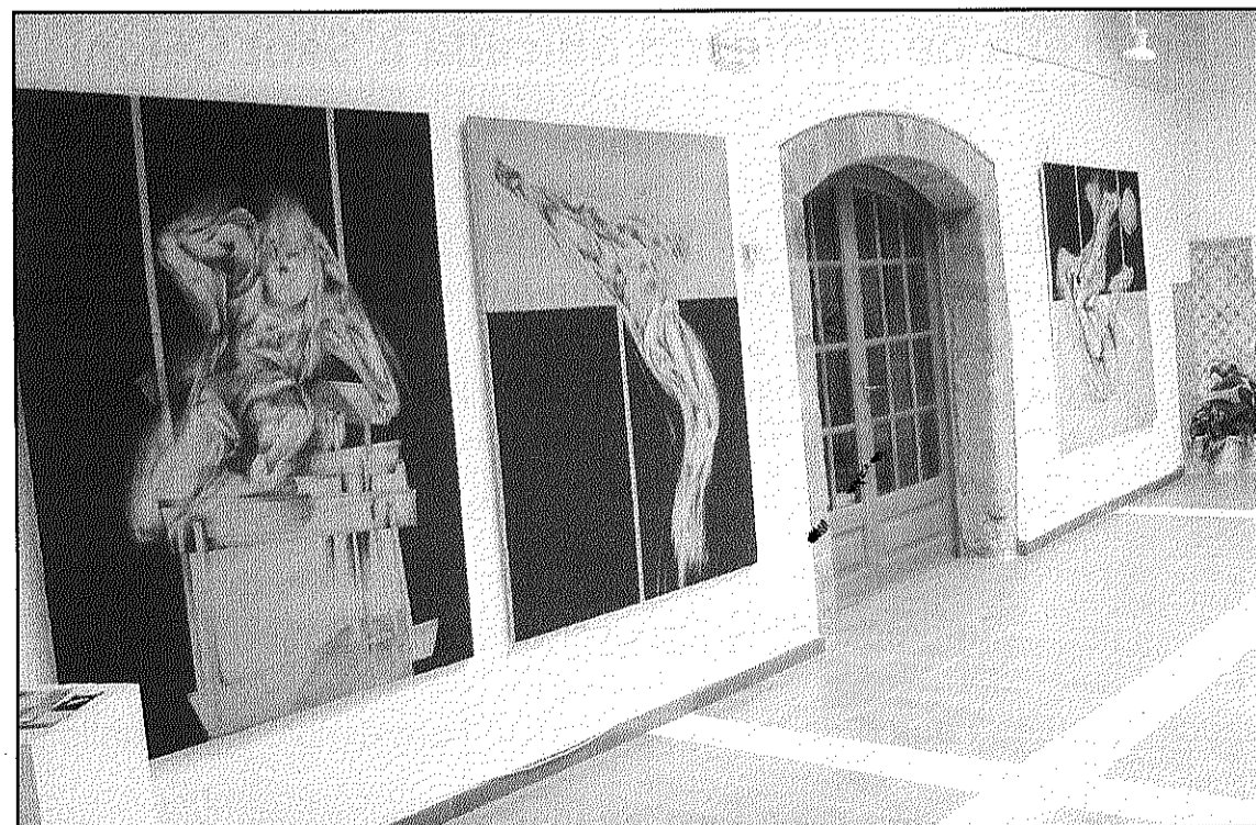
Algunes de les pintures que recull la mostra de la Rectoria Vella de Sant Celoni