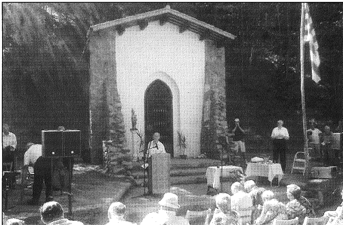
Diumenge, nombroses persones van assistir a la inauguració de l'ermita, reconstruïda a l'estiu

La primera pedra de la reconstrucció de l'ermita es va col·locar en un acte simbòlic, oficiat pel Pare Gil, rector de la parròquia de Sant Martí del Montnegre el passat mes de maig. A la cita, a la que van acudir un centenar de persones, es van recaptar més de 300 euros que es van destinar a la reconstrucció de l'espai. Va ser durant aquest acte, també, que es va exposar el projecte que es volia impulsar i que tenia un cost