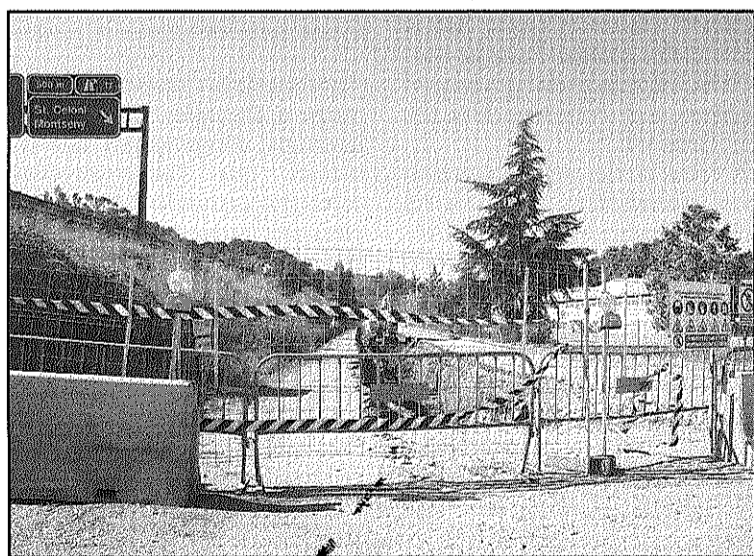
La instal·lació de conductes obliga a obrir un pas alternatiu (L'AdBM)

REDACCIÓ. Sant Celoni Les obres d'instal·lació de les conduccions que han de portar l'aigua des de la planta dessalinitzadora de Blanes fins al dipòsit de Cardedeu, han obligat, al tram que afecta a Sant Celoni, a tallar temporalment l'accés a Olzinelles des de la rotonda de l'Altrium.