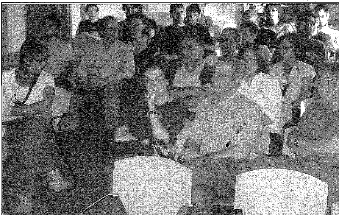
Una imatge dels assistents a l'Assemblea celebrada el passat dissabte a la Rectoria

Els primers punts de l'Assemblea, celebrada a la sala d'actes de la Rectoria Vella, van fer referència, però, a l'acció feta durant els dos primers anys en què la CUP ha estat representada al Consistori amb dues regidories. En aquest sentit, es van