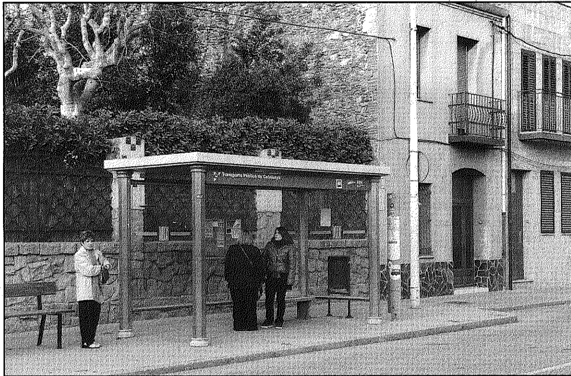
La T-12 no permet anar de Cardedeu a Sant Celoni de franc per ser zones diferents (L'AdBM)

En el cas del Baix Montseny, però, la vintena de municipis de la comarca estan separats en set àmbits tarifaris diferents. Així, Cardedeu, Llinars i Sant Antoni de Vilamajor són a l'àmbit 3D; Breda, Campins, Fogars de Montclús, Gualba, Riells, Montseny, Sant Esteve de Palautordera, Sant Celoni, Sant Pere de Vilamajor, Santa Maria de Palautordera, Vallgorguina i Vilalba són de l'àmbit 4G; Hostalric del 5G; Fogars del 5H; Massanes del 6G; i Arbúcies, Sant Feliu de Bui-